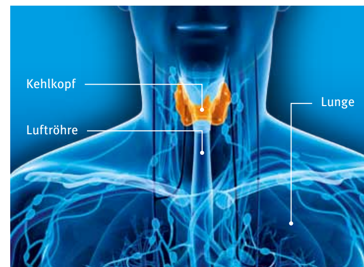
Der Kehlkopf und benachbarte Organe

Der Kehlkopf ( Larynx ) befindet sich am Übergang des Rachens in die Luft- und Speiseröhre. Prinzipiell hat er drei Hauptfunktionen: Als Pförtner der unteren Luftwege ermöglicht er erstens, dass Sie atmen können, zweitens verhindert er, dass beim Schlucken Nahrung in die Luftröhre gerät, und drittens bildet er die Stimme und sorgt so dafür, dass Sie Laute bilden, also sprechen können.